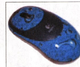
Dem spielerischen Design des Wassertransferdruckes sind keine Grenzen gesetzt.