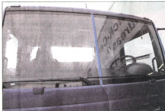
Bessere Sicht dank Lotusblüten-Effekt: Die rechte Hälfte der Frontscheibe ist veredelt, auf der linken unbehandelten Hälfte bleibt das Regenwasser haften.