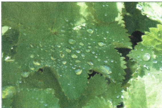
Auf dem Blatt der „nano-Effekt“ der Lotusblüten.