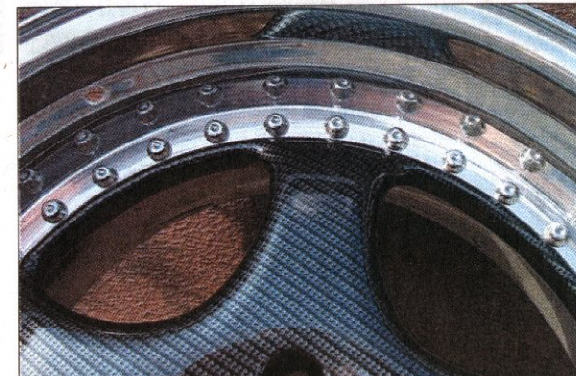
Der Carboneffekt gibt den Felgen eine elegante und sportliche Optik.