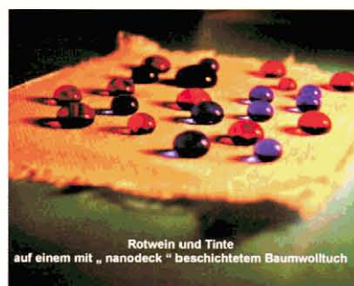
Rotwein und Tinte auf einem mit „nanodeck“ beschichtetem Baumwolltuch