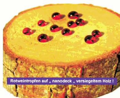
Rotweintropfen auf „nanodeck“ versiegeltem Holz!

Die Firma „nanodeck“ bietet nicht nur ihre Produkte an, sondern auch Service Leistungen: Auto-, Yacht & Boot -, Wintergärten-, Fenster-, Steinflächen-, Fassaden-, Holz-, Sanitärkeramik-, Wand- & Boden-, Textil- & Polster und sogar Flugzeug-Versiegelungen. Vorsicht !!! - Sagt uns ein Mitarbeiter der Firma „nanodeck“: Nicht überall wo NANO draufsteht ist auch „echte“ Nano-Technologie drin! Oft werden